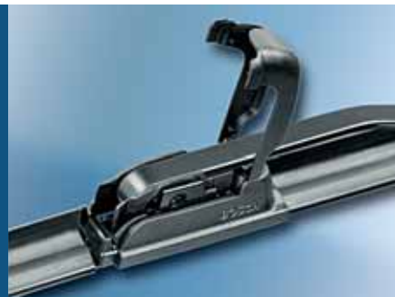
3. Bevestiging sluiten. Klaar!