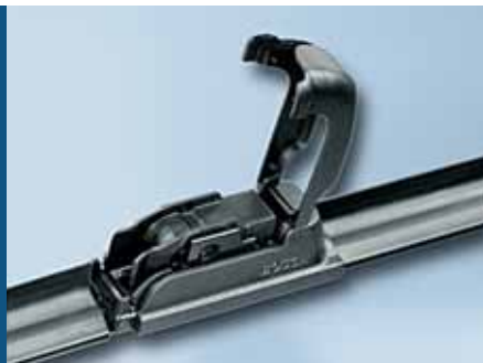
1. Open de bevestiging