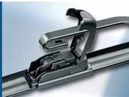
2. Haak doorhalen en insteken